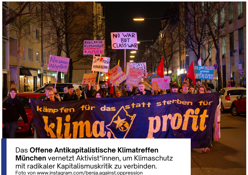
Das Offene Antikapitalistische Klimatreffen München vernetzt Aktivist*innen, um Klimaschutz mit radikaler Kapitalismuskritik zu verbinden.

Sie sagen uns: „Sicherheit geht vor!“. Doch wessen Sicherheit? Durch die Klimakrise sterben bereits jetzt Hunderttausende, Konflikte um knapper werdende Ressourcen häufen sich und Menschen werden vertrieben – um auf hochgerüstete Grenzen zu stoßen. Statt in sichere Fluchtrouten, Klimaschutz, gute Schulen und Krankenhäuser fließen Hunderte Milliarden in Aufrüstung. Die Konzernkassen klingeln. Bei Krieg und Klimakrise zeigt sich die Natur des Kapitalismus: Es geht um Profitmaximierung und nicht um menschliche Bedürfnisse. Es geht um wirtschaftliche Vormachtstellung und Zugang zu Ressourcen.