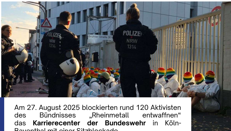
Am 27. August 2025 blockierten rund 120 Aktivisten des Bündnisses „Rheinmetall entwaffnen“ das Karrierecenter der Bundeswehr in Köln-Bayenthal mit einer Sitzblockade.

Noch ein Nachsatz: Ich bin keine Pazifistin. Ich würde auch mit Gewalt mich bei Gefahr verteidigen oder weglaufen („desertieren“) und Menschen helfen, die bedroht werden.